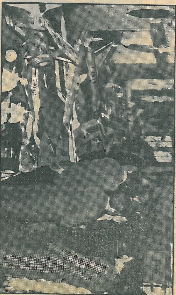
Quelque 3000 personnes ont visité samedi et dimanche ce salon international du modèle réduit.